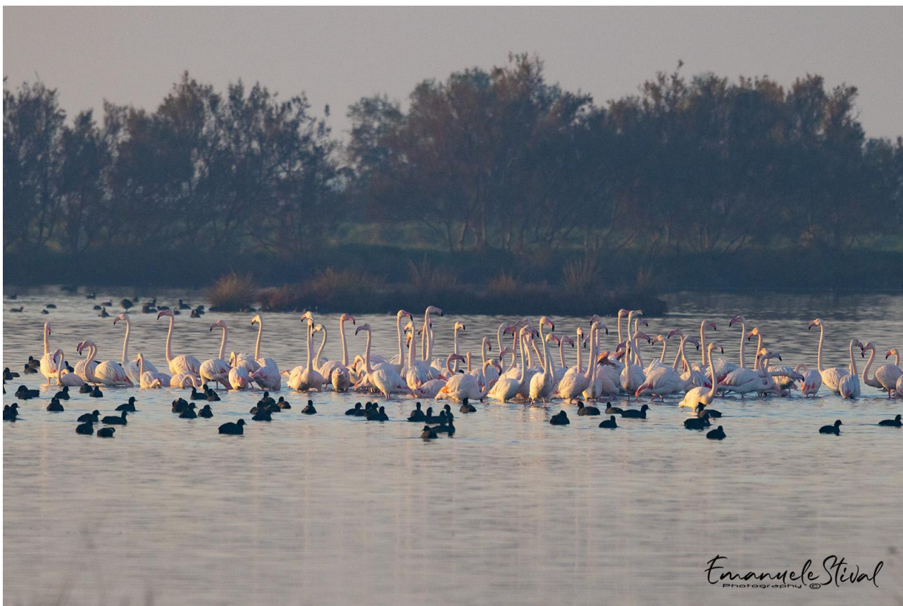
Raggruppamento di fenicotteri e folaghe in valle Dogà